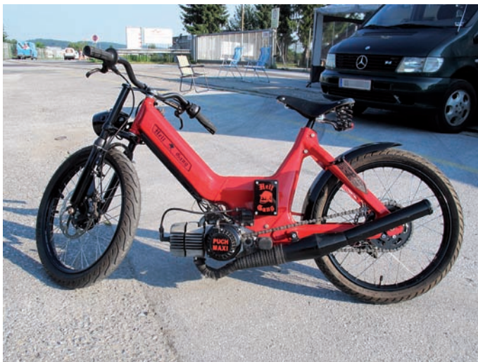
Custom Maxi der Hell Gang