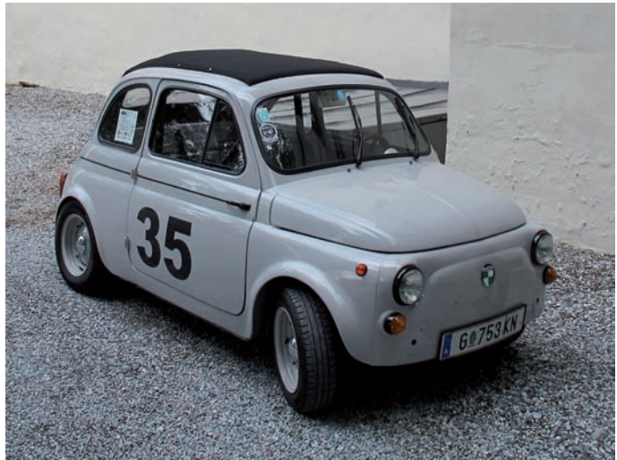
Steyr-Puch 650 TR2

Das Projekt „ Mythos Puch “ hat sich zu einem kontrastreichen Beispiel für kollektive Kulturarbeit in der Region entwickelt.