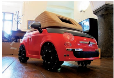
Fiat Lux (Zweite Ausbaustufe)